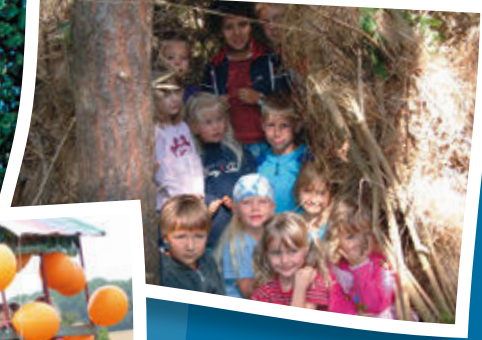
Die wilden Höhlenkinder