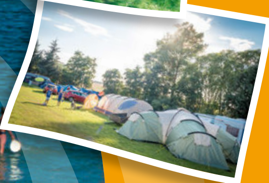
Blick über Nachbarn und Felder