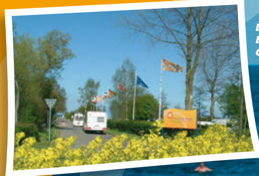
Da sind wir! Einfahrt zum Campingplatz